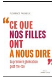
Ce que nos filles ont à nous dire : la première génération post-me-too PAGNEUX, Florence La Mer Salée, 2022, 204 p.

" Où et pourquoi se mobilise-t-on aujourd'hui en France ? Il existe, dans certains territoires, une tradition de lutte spécifique qui s'est ancrée localement et se perpétue. Du littoral breton aux banlieues parisiennes, de la campagne basque aux universités lyonnaises en passant par l'archipel guadeloupéen, le journaliste Romain Jeanticoû est allé à la rencontre de celles et ceux qui mènent ces combats. [...] À Grenoble, Anne, jeune militante féministe, renouvelle les combats du tout premier planning familial du pays. À travers sept territoires et des dizaines de récits intimes et politiques, l'auteur dresse [...]"