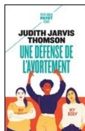
Une défense de l'avortement JARVIS THOMSON, Judith Payot, 2023, 86 p.