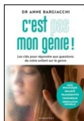
C'est pas mon genre ! : les clés pour répondre aux questions de votre enfant sur le

" " Dans cet essai publié en 1978, Françoise d'Eaubonne montre que l'exploitation de la nature et l'oppression des femmes ont un dénominateur commun : le patriarcat. Si les hommes se sont au cours des siècles approprié la fertilité des femmes et de la terre, un autre seuil a été franchi avec l'expansion du capitalisme à l'échelle mondiale : c'est la vie même qui est désormais menacée. Rejetant l'injonction permanente à la croissance démographique et économique, la pionnière française de l'écoféminisme insiste sur les limites de la planète et épingle les [...]"