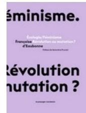
Écologie/Féminisme : révolution ou mutation ? D'EAUBONNE, Françoise Le Passager clandestin, 2023, 349 p.